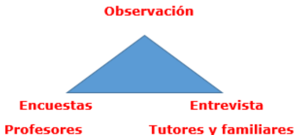
Fig. 2. - Triangulación metodológica

Existe correspondencia entre las debilidades declaradas por los profesores en las encuestas y observaciones; las respuestas con mayor incidencia estuvieron dirigidas a la escala valorativa Casi Nunca, la que recoge el 85 % de las respuestas y un 10 % la escala Nunca y el resto de los puntos que se corresponden con un 5 % es para el resto de la escala valorativa.