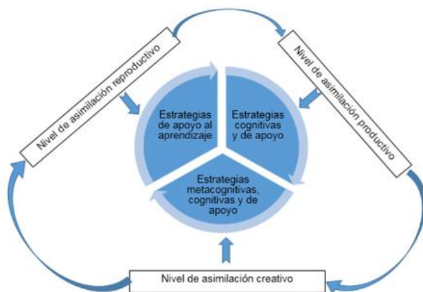
Fig. 1. - Dimensiones e indicadores más representativos de la variable

Para la selección de las dimensiones e indicadores de estudio se adoptaron las clasificaciones de estrategias de aprendizaje (Figura 1).