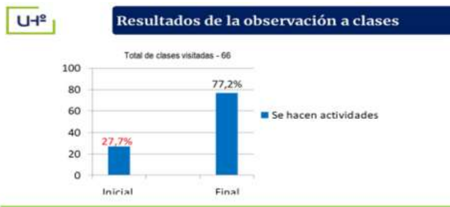
Fig. 2. - Tabulación inicial y final de clases y unidades de entrenamiento observadas

Por otra parte, los resultados de la encuesta final realizada a los estudiantes evidenciaron una mejoría relacionada con la vocación, intereses profesionales, las metas trazadas y los objetivos profesionales de carácter inmediato, además de mostrar mayor seguridad en la selección de la LCF al estar más familiarizados con las particularidades de la misma; lo que significó un desarrollo de la vocación por la Carrera (Figura 3).