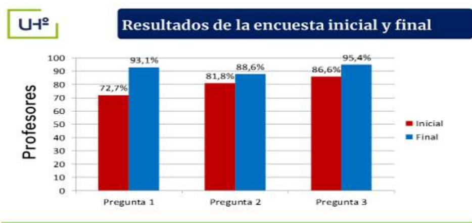
Fig. 4. - Tabulación de la encuesta inicial y final a los profesores de la Eide

curricular, extracurricular y sociopolítico, donde se establece el vínculo escuela, familia, comunidad que permiten el desarrollo de la vocación; la mayoría aprobó el contenido relacionado con el tratamiento a la orientación vocacional del estudiante preuniversitario hacia la LCF, en las preparaciones metodológicas a nivel de centro (Figura 4).