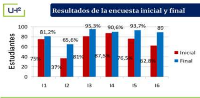
Fig. 3. - Tabulación de la encuesta inicial y final a los estudiantes

Por otra parte, los resultados de la encuesta final realizada a los estudiantes evidenciaron una mejoría relacionada con la vocación, intereses profesionales, las metas trazadas y los objetivos profesionales de carácter inmediato, además de mostrar mayor seguridad en la selección de la LCF al estar más familiarizados con las particularidades de la misma; lo que significó un desarrollo de la vocación por la Carrera (Figura 3).