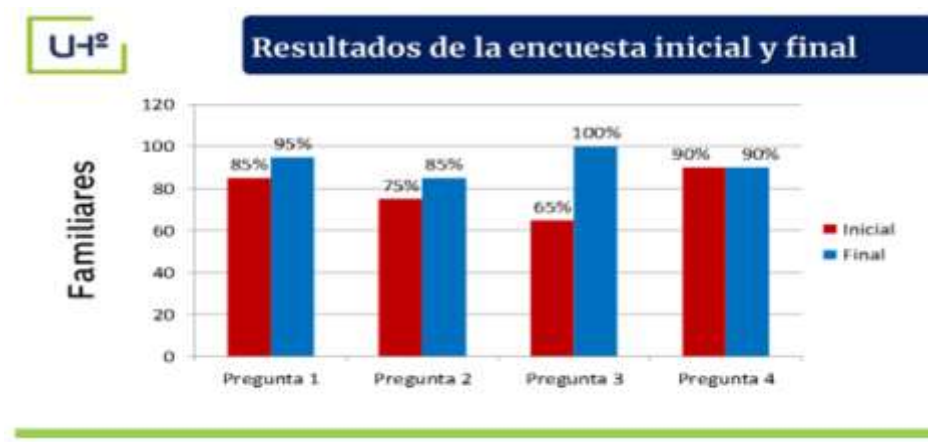
Fig. 5 - Tabulación de la encuesta a los familiares de los estudiantes preuniversitarios de la Eide

Los resultados finales obtenidos coinciden con los estudios de Carpio y Guerra (2017) que reconocen en las actividades relacionadas con la orientación vocacional un carácter metodológico, de superación e investigación orientadas a capacitar a los agentes educativos, de ahí que se justifica el contexto de la LCF y su incidencia en el proceso formativo de los estudiantes preuniversitarios de la Eide.