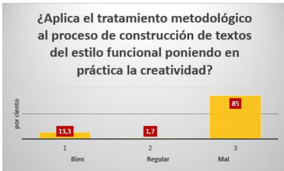
Fig. 3. Resultados de la encuesta aplicada a profesores. Pregunta 3.