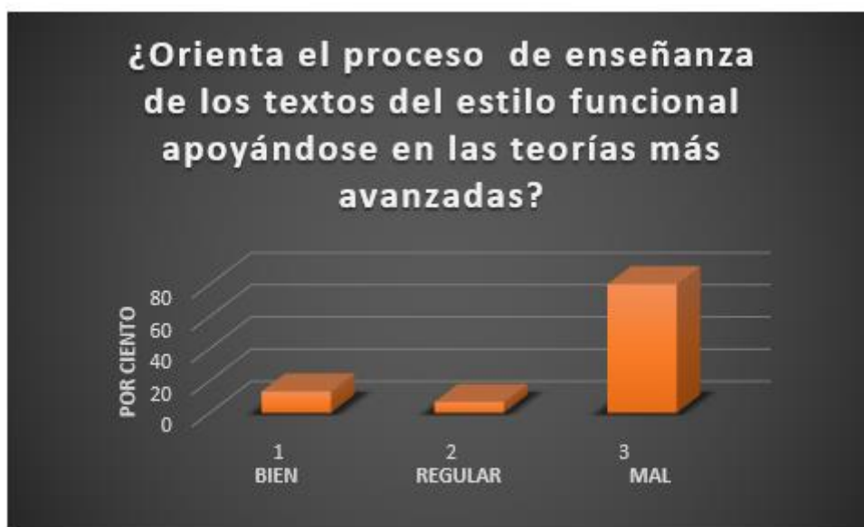
Fig. 2. Resultados de la encuesta aplicada a profesores. Pregunta 2.