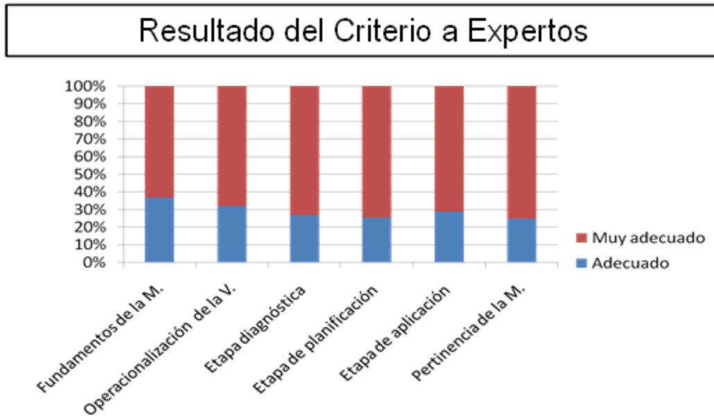
Fig. 1. Resultado de la consulta a expertos.

Entre los criterios y sugerencias más significativas se encuentra extender la superación actualizada en las áreas de la evaluación en Educación Física escolar a escolares con discapacidad intelectual desde profesores en formación hasta los que se encuentran impartiendo clases, así como resaltar las acciones formativas correctivas compensatorias de los juegos predeportivos elaborados al respecto.