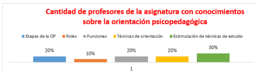
Fig. 1 - Resultados de la entrevista grupal a profesores de la asignatura Español básico

Se presenta la caracterización del proceso de orientación psicopedagógica en la asignatura Español básico en la carrera de Cultura Física del CPE en la Universidad de Pinar del Río "Hermanos Saíz Montes de Oca" a partir del comportamiento de cada instrumento aplicado. Durante la entrevista a profesores acerca del conocimiento sobre el proceso de orientación psicopedagógica de forma general no conocen las particularidades (Figura 1).