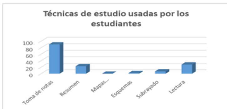
Fig. 3 - Resultados de la encuesta realizada a los estudiantes

En la encuesta, los estudiantes refirieron que desconocen el uso de técnicas de estudio (Figura 3).